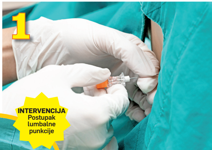
1 INTERVENCIJA Postupak lumbalne punkcije

Doktorica dalje navodi koje su indikacije za lumbalnu punkciju: - Poremećaji svesti bilo kog ste-